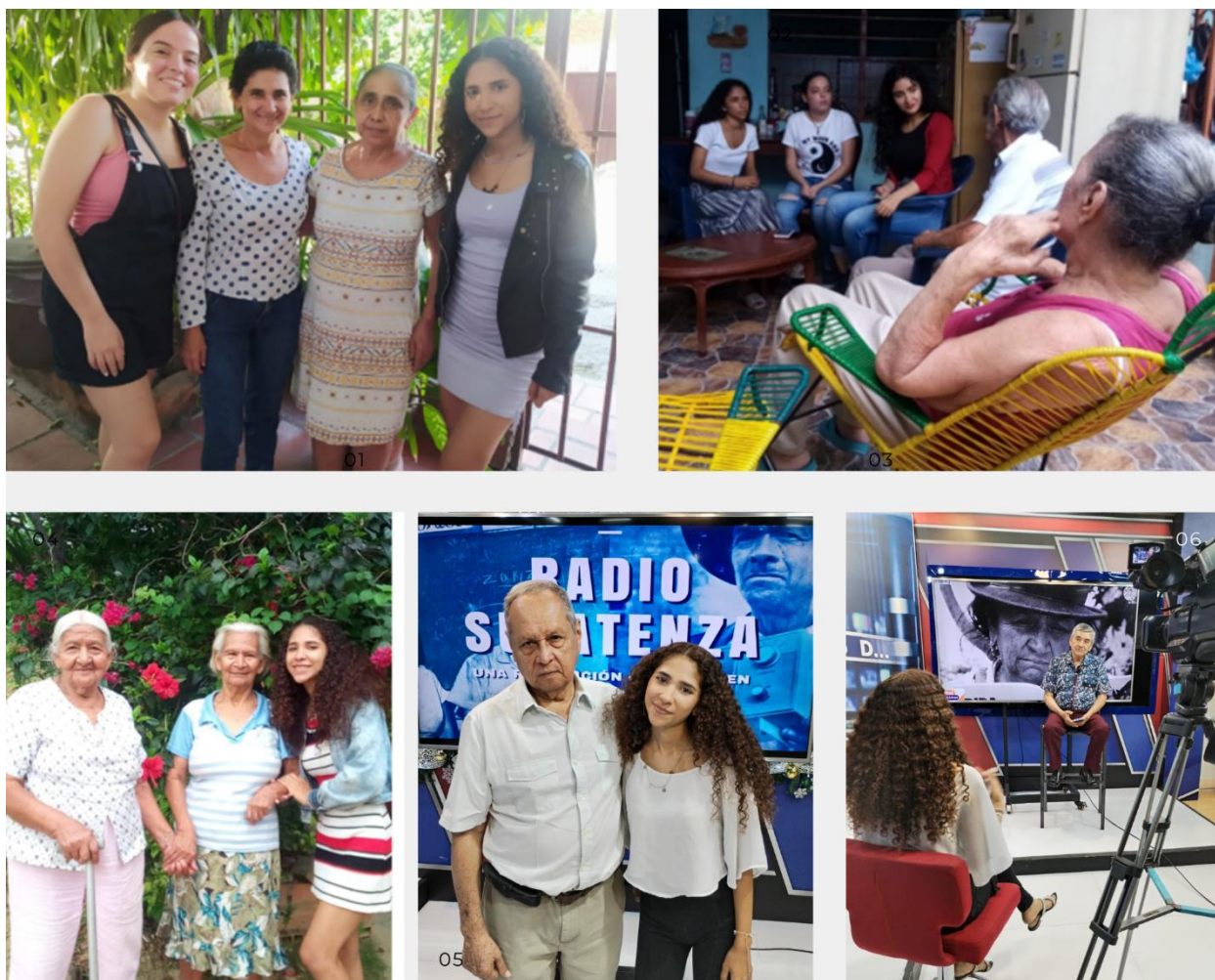
Ilustración 2. Realización de entrevistas

familia, se pudo obtener una comprensión más profunda y completa de su contexto y experiencias de vida relacionadas con el tema de estudio.