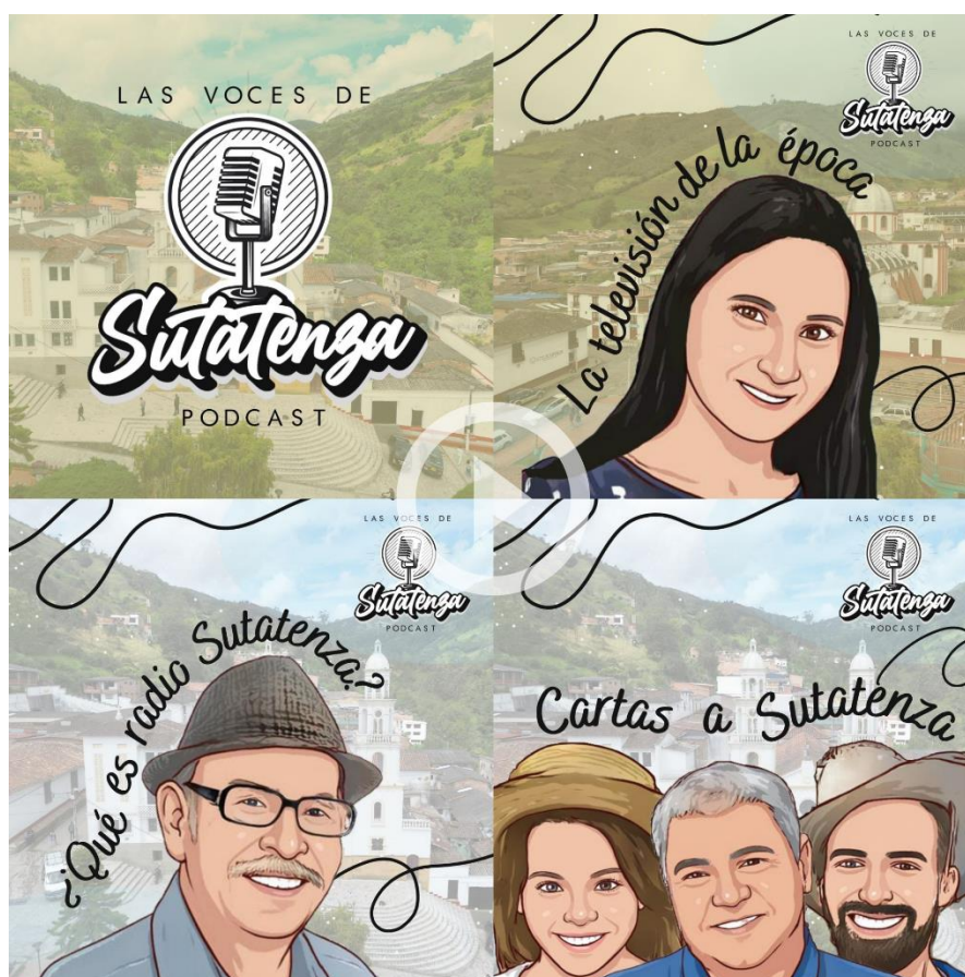
Ilustración 4. Ilustraciones del pódcast “Las Voces de Sutatenza”

Desde un inicio, se buscó que la serie de pódcast tuviera identidad propia, una que, a partir de un nombre, reflejará lo que se quiso transmitir al narrar estas historias, y es así que nació “Las voces de Sutatenza” un pódcast compuesto por diez capítulos que narran diferentes vivencias en la región. La planificación de su distribución fue algo fundamental desde el principio, de ahí que el pódcast arrancará con el primer capítulo titulado “¿Qué es Radio Sutatenza?” esto con la finalidad de brindar a cualquier oyente, una visión completa del tema central desde un principio hasta el fin, permitiendo que los capítulos subsiguientes donde se narraban las experiencias y anécdotas fueran plenamente entendibles para personas de todas las edades y futuras generaciones.