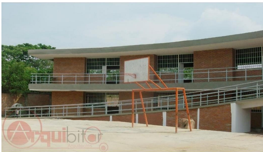
Figura 2. Instalaciones