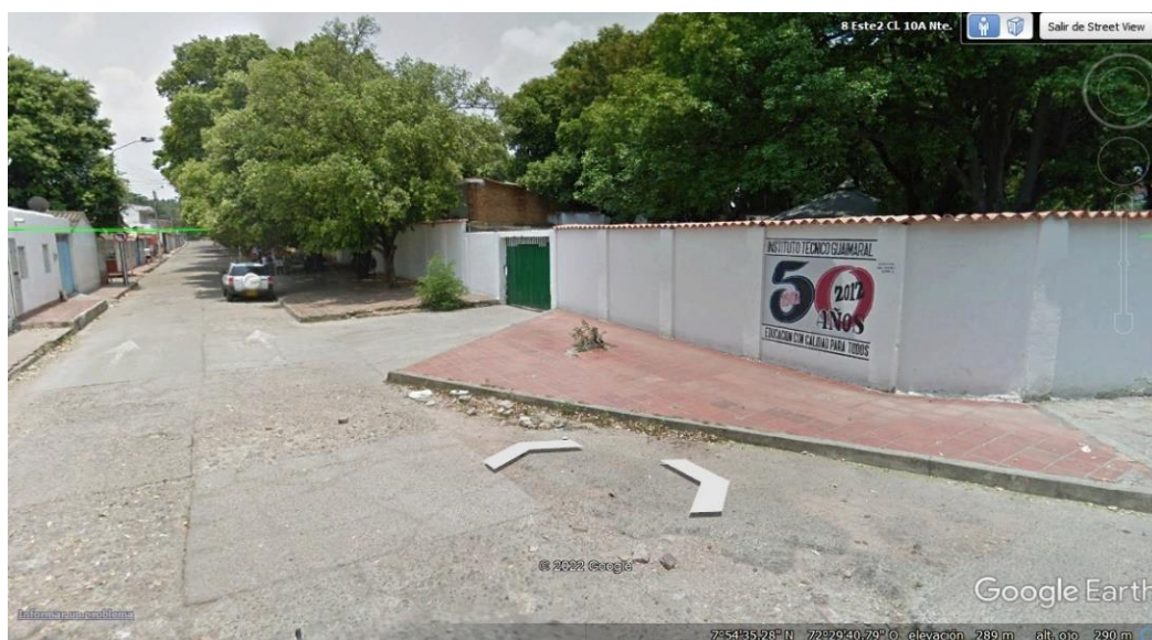
Figura 2. Foto del Instituto Tecnico Guaimaral de Google earth .