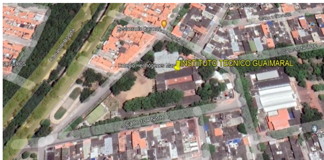
Figura 3. Ubicación de la Institución educativa en el área metropolitana.

La comunidad del Instituto Técnico Guaimaral posee un fuerte tejido social y se caracteriza por ofrecer una educación inclusiva de calidad con aspectos como buena tecnología, ciencia y desarrollo del siglo XXI con la finalidad de desarrollar en los estudiantes competencias integrales con el propósito de construir una sociedad equitativa, empática y pluricultural.