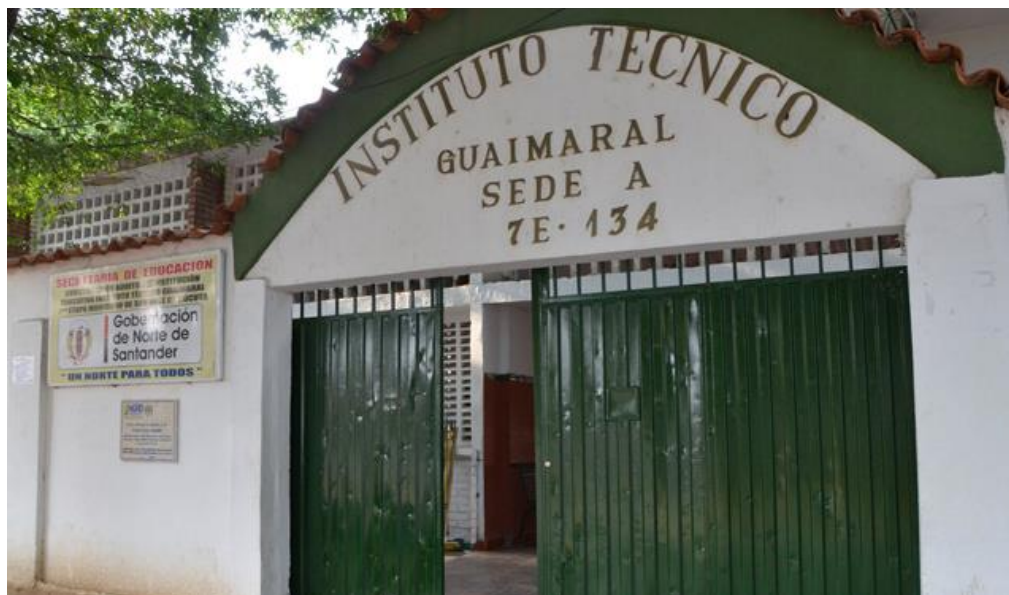
Figura 1. Foto de google Instituto Técnico Guaimaral. Fuente: Tomado de Google Chrome

Por otra parte, las tipologías de familia encontradas en los educandos son; nucleares, extensas, monoparentales y reconstituidas y estas son pertenecientes a los estratos socioeconómicos dos (2) y tres (3).