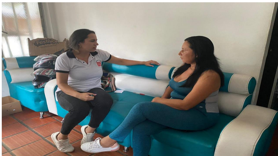
Imagen 2. Aplicación de la entrevista