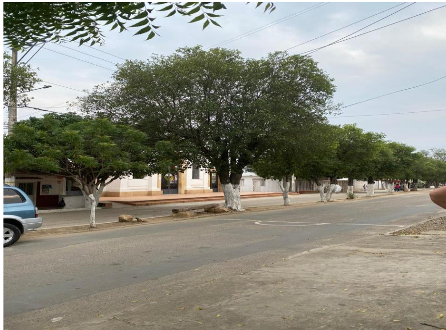
Imagen 4. Imagen el Barrio