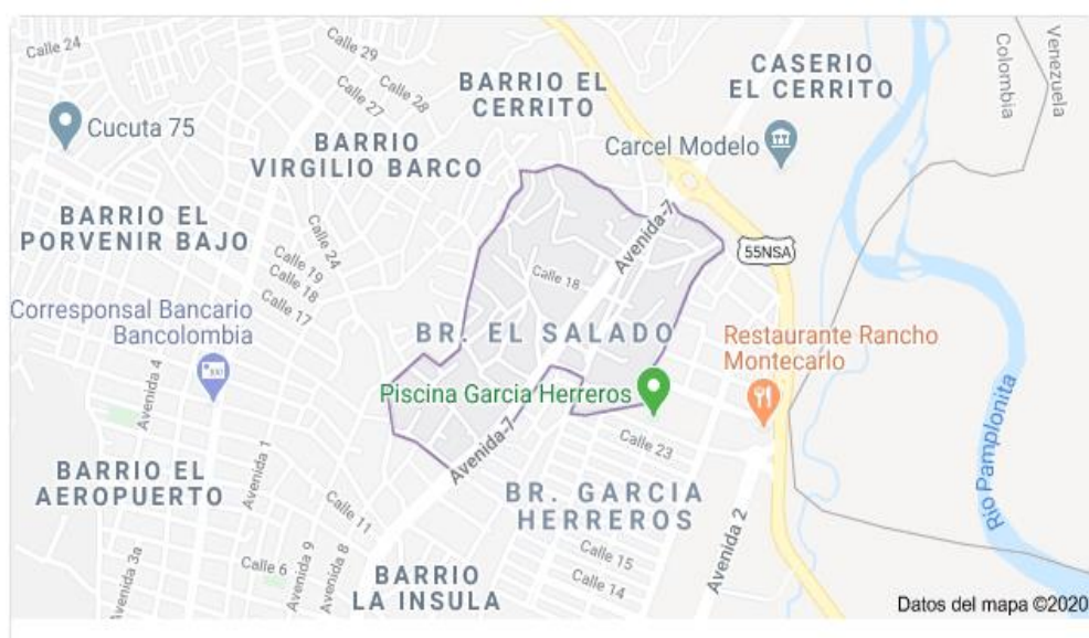
Figura 1. Br. El Salado, Cúcuta, Norte de Santander

Además por su cercanía con la frontera de Venezuela sirvió como pasaje para el llevar de mercancías por contrabando y a su vez tener habitantes con doble nacionalidad que venían a trabajar cortando caña y así se generaba la economía del barrio. En la actualidad el barrio El Salado cuenta con más de 5 mil habitantes y está situado en la comuna 6 del municipio de Cúcuta, teniendo a sus alrededores los barrios La Ínsula, El Panamericano, Virgilio Barco y García Herreros.