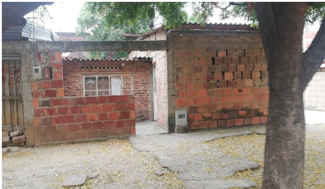
Imagen 1. Casa de un entrevistado