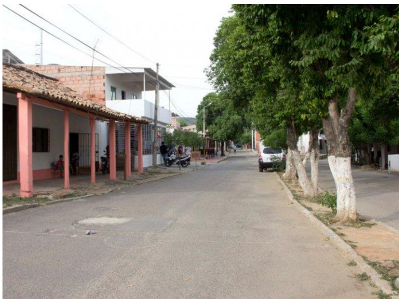
Figura 2. Calle principal del Barrio El Salado Cúcuta Norte de Santander

El barrio El Salado cuenta con una gran variedad de establecimientos comerciales como almacenes, salones de belleza, talleres, bares y cervecerías además cuenta con entidades públicas como el plantel educativo Eustorgio Colmenares y el puesto de salud, servicios que están al alcance de los habitantes del sector, de ese modo mucho de los residentes ven una oportunidad para ejercer el trabajo ya sea de manera formal e informal por la gran influencia de personas que residen en el sector, al igual por portar estas características hace que también llame la atención en los migrantes venezolanos quienes ven en este sector una alternativa para poder vivir, trabajar y desarrollar su proyecto de vida.