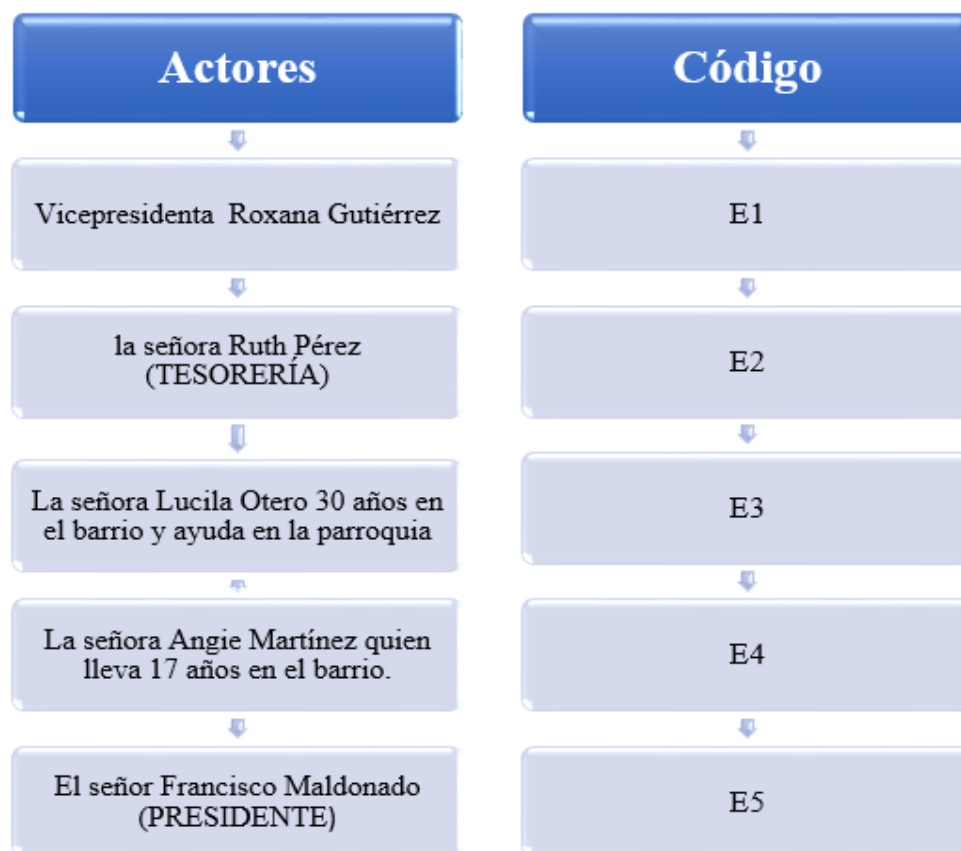
Figura 3. Actores de la muestra

parezca sutil, es una diferencia crucial e importantísima puesto que se trata de entrevistas al grupo, no a un conjunto de personas, o a una serie de personas ( Iñiguez , 2008).