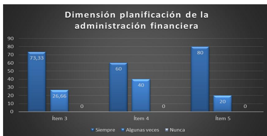
Figura 2. Respuesta de los trabajadores en la dimensión planificación de la administración financiera

20% restante de los trabajadores considera que este hecho solo ocurre algunas veces. Razón por lo cual se amerita de un proceso de planificación integral que dinamice la gestión empresarial y la participación que las empresas logran tener en el mercado para materializar una función de acción por medio de los bienes y servicios que ofrece en la búsqueda de representar las razones que orientan los procesos operativos desde la gestión financiera.