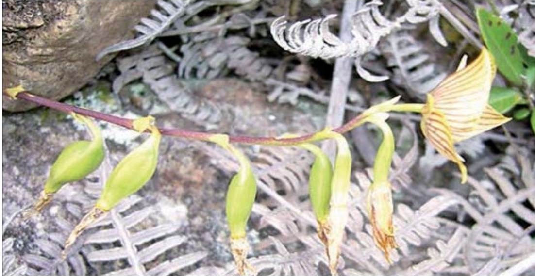
Figura 2. Flor y capsula de la especie Telipogon dubios , encontrada en la vereda El Escorial Pamplona Norte de Santander - Colombia.