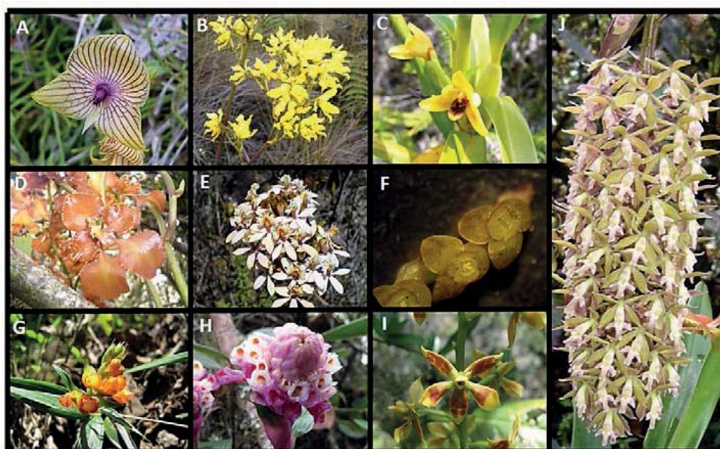
Figura 1. Flores de las especies de orquídeas encontradas en la vereda El Escorial Pamplona Norte de Santander-Colombia. (A) Telipogon dubius (B) Odontoglossum lindenii (C) Maxillaria sp. (D) Cyrtochilum sp. (E) Epidendrum elongatum (F) Stelis sp. (G) Elleanthus aurantiacus (H) Elleanthus sp. (I) Prosthechea sp. (J) Epidendrum sp.