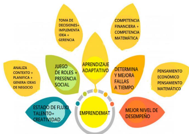
Figura 2. Estrategia pedagógica EMPRENDEMAT.

El análisis de satisfacción (Figura 2), permite observar que la estrategia EMPRENDEMAT potencia el aprendizaje adaptativo, mejora la determinación de fallas y asesoría por parte del docente, mejora las calificaciones de los jóvenes en matemáticas y matemática financiera, su método incluye juego de roles lo que motiva a los jóvenes a desarrollar estrategias de negocio y evaluar los resultados de sus negociaciones, mejora la concentración, despierta interés, creatividad y su curiosidad.