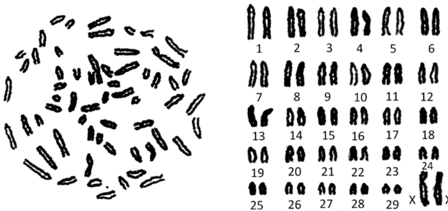
b. Célula metafásica y cariotipo de Bos taurus taurus x Bos taurus indicus hembra (XX).