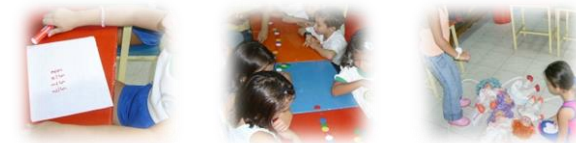
Figura 1. Implementación talleres como estrategia pedagógica.

La proporción de niños (59.4%) estudiados fue mayor con respecto a las niñas (40.6 %), la edad media fue 5,5 \pm 0,5 y la distribución por grado de escolaridad fue la misma. La mayoría de los niños pertenecían al estrato socioeconómico tres (3), el 80,3 % vivía en vivienda de ladrillo de un piso, 17,7 % en vivienda de dos (2) pisos. La edad media de la madre al momento del embarazo fue 20,6 \pm 7 años de edad; los padres habían cursado la secundaria completa y 12,8 % de ellas habían cursado estudios tecnológicos o universitarios.